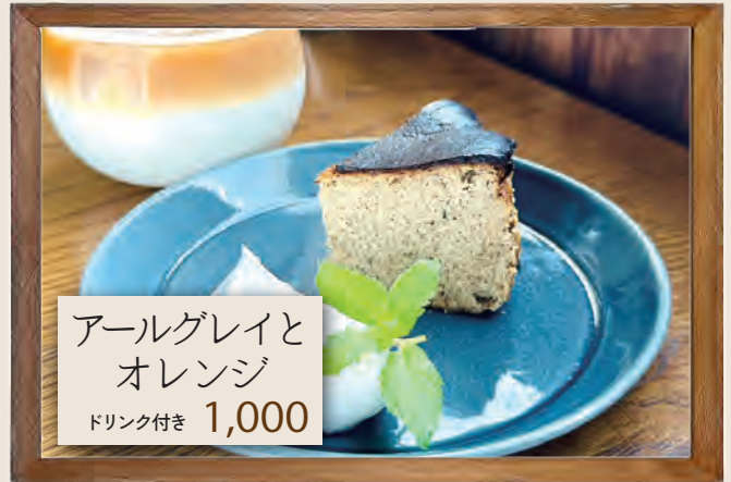
アールグレイと オレンジ ドリンク付き 1,000