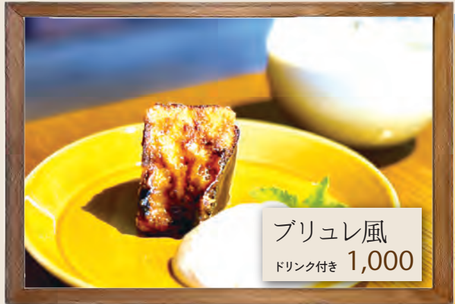
ブリュレ風 ドリンク付き 1,000