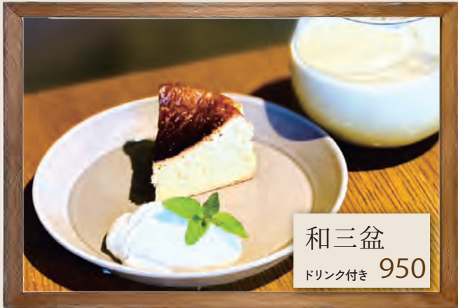
和三盆 ドリンク付き 950