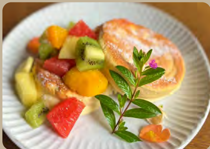
窯焼きフルーツパンケーキ 1,100