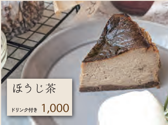
ほうじ茶 ドリンク付き 1,000