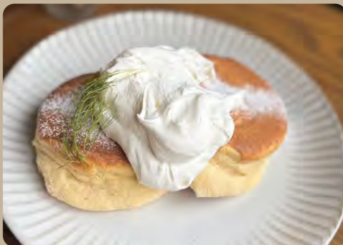
窯焼きパンケーキ + ホイップ 1,100