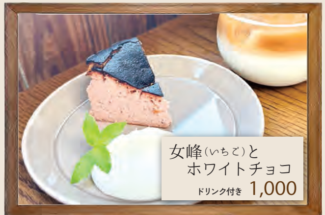
女峰(いちご)と ホワイトチョコ ドリンク付き 1,000