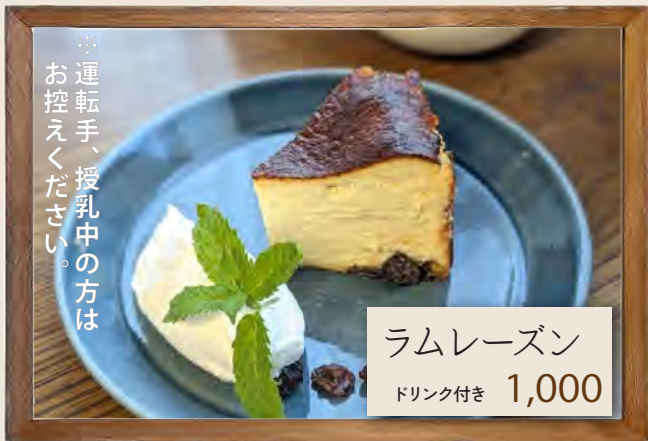
ラムレーズン ドリンク付き 1,000